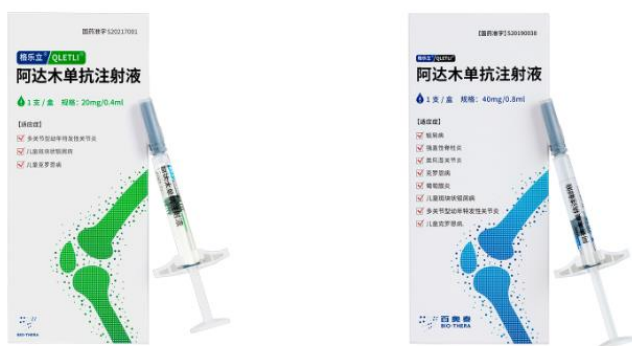
阿达木单抗注射液（20mg/0.4ml）