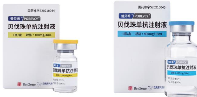
贝伐珠单抗注射液（100mg/4mL）